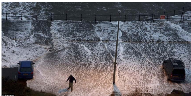
A man stands in water washed onto the promenade of the north bay in Scarborough, which was described as looking like a 'scene from the Titanic