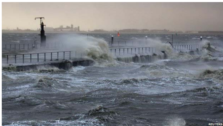
The tidal surge battered Emden in north Germany, near the Dutch border