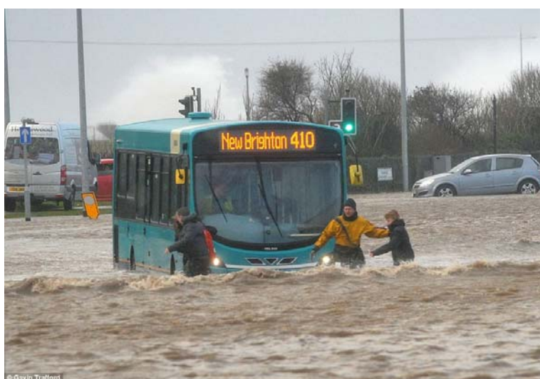
Walk this way: Road markings are impossible to see in New Brighton, Merseyside, as the 410 bus tries to make its way through