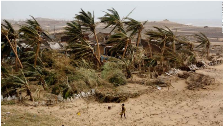
A woman returns to the village of Arjipalli on India's Bay of Bengal coast on October 13.