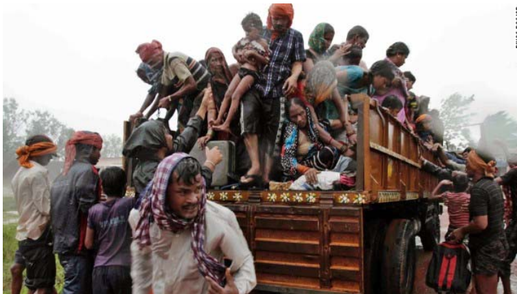
Evacuated villagers climb down from a truck at a relief camp near Berhampur on October 12