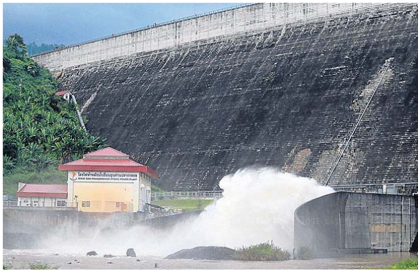
The Khun Dan Prakan Chon dam in Nakhon Nayok province is releasing more water to ease a recent increase in the dam level caused by persistent rainfall. THANARAK KHOONTON